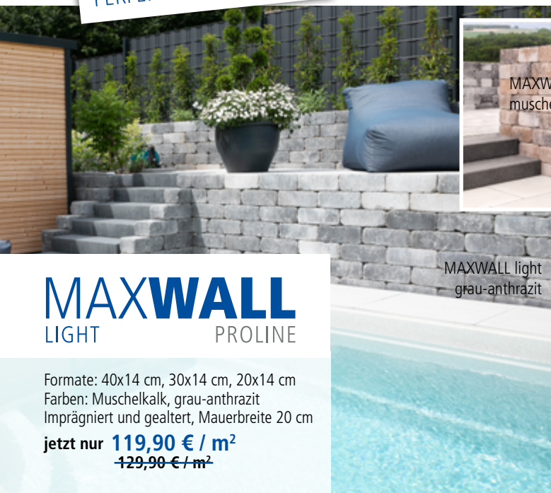
MAXWALL light muschelkalk