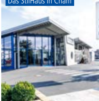
Das StilHaus in Cham